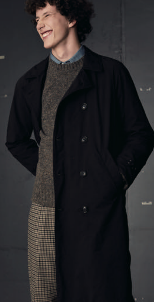
2 3 4 5