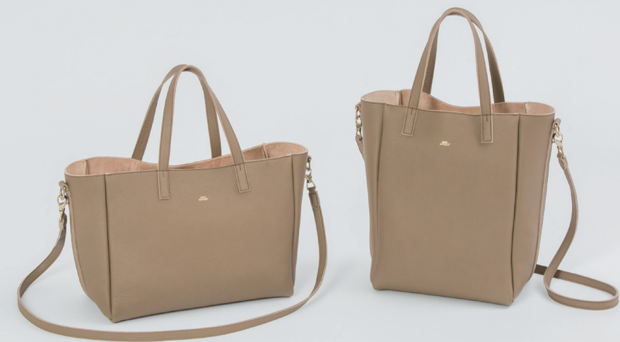
Left → 2way Tote Bag 18/53/LD W31×H24×D14cm ¥85,000 2way Tote Bag 18/54/LD W23×H32×D14cm ¥87,000