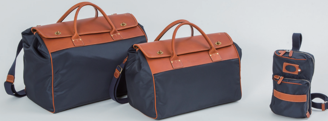
Left → Boston Bag 20307/DS W45×H33×D26cm ¥110,000 Boston Bag 20308/DS W41×H28×D23cm ¥100,000 One Shoulder Bag 18/42/1/DS W15×H25×D8cm ¥42,000

定番モデルをベースに機能や実用性を加え、新化したモデルや(左頁)、柔らかくしっとりとした質感が特徴のキップレザーを使用したレディスコレクション(右頁)など、今のライフスタイルに合わせたアイテムを提案します。