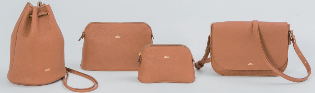
Left → Drawstring Pouch 18/55/LD W17×H24×D14cm ¥60,000 Pouch 1020/LD W23×H15×D7cm ¥32,000 Pouch 1019/LD W17×H11×D7cm ¥27,000 Shoulder Bag 18/57/LD W24×H17×D8cm ¥83,000