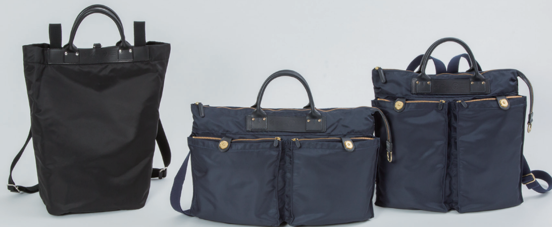
Left → 2way Rucksack 18/51/DS W24×H42×D20cm ¥59,000 2way Tote Bag 18/46/DS W47×H29×D5-14cm ¥79,000 2way Tote Bag 18/50/DS W39×H38×D5-14cm ¥79,000